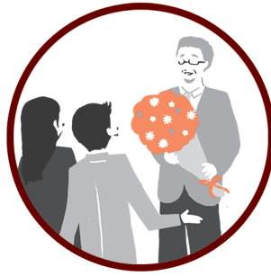
定年退職を迎えた