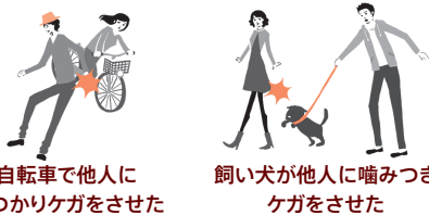
自転車で他人にぶつかりケガをさせた

国内外において、日常生活で他人にケガをさせたり他人の物を壊してしまったときや、国内で他人から借りた物や預かった物(受託品)*1を国内外で壊したり盗まれてしまったとき等、法律上の損害賠償責任を負った場合に保険金をお支払いします。*1 携帯電話、ノートパソコン、自転車、コンタクトレンズ、眼鏡、1個または1組で100万円を超える物等は、受託品に含まれません。*国内での事故(訴訟が国外の裁判所に提起された場合等を除きます。)に限り、示談交渉は原則として東京海上日動が行います。