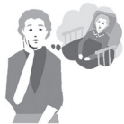
介護の一時費用 がかかった