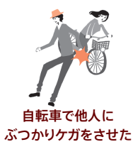
自転車で他人にぶつかりケガをさせた

国内外において、日常生活で他人にケガをさせたり他人の物を壊してしまったときや、国内で他人から借りた物や預かった物(受託品) *1 を国内外で壊したり盗まれてしまったとき等、法律上の損害賠償責任を負った場合に保険金をお支払いします。 *1 携帯電話、ノート型パソコン、自転車、コンタクトレンズ、眼鏡、1個または1組で100万円を超える物等は、受託品に含まれません。※国内での事故(訴訟が国外の裁判所に提起された場合等を除きます。)に限り、示談交渉は原則として東京海上日動が行います。