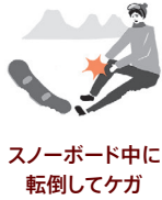
スノーボード中に転倒してケガ