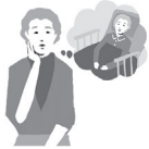
介護の一時費用 がかかった