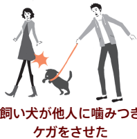
飼い犬が他人に噛みつきケガをさせた